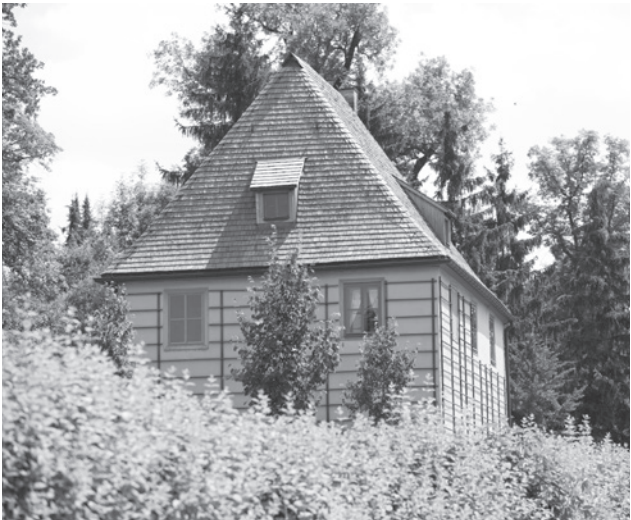
Abb. 5: Goethes Gartenhaus im Ilmpark Weimar