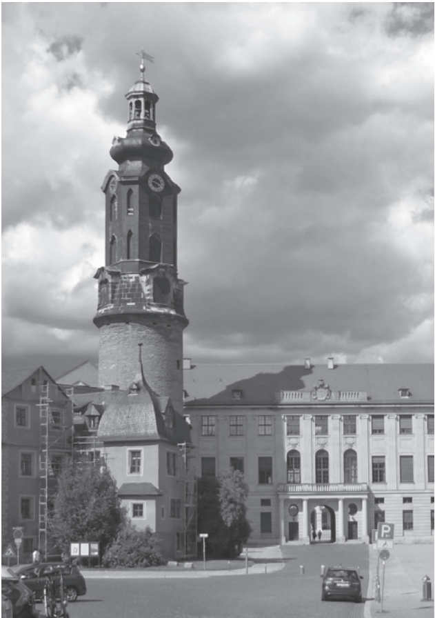
Abb. 3: Stadtschloss Weimar