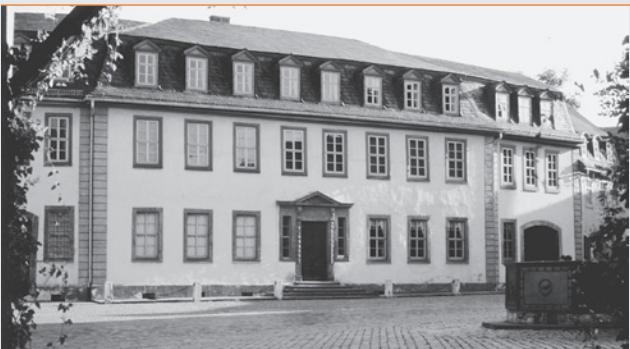
Abb. 4: Das Goethe-Nationalmuseum in Weimar

Änderungsanträge zur Tagesordnung senden Sie bitte bis zum 16. Mai 2025 (Poststempel) an den Präsidenten. Später eingereichte Anträge bedürfen der Zustimmung der Mitgliederversammlung.