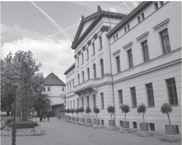
Abb. 2: Jugend- und Kulturzentrum mon ami am Goetheplatz in Weimar

Entstehungsprozess der Italienischen Reise