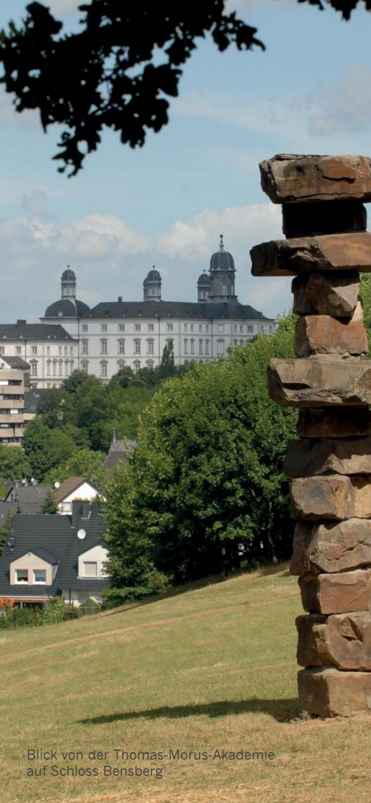
Blick von der Thomas-Morus-Akademie auf Schloss Bensberg